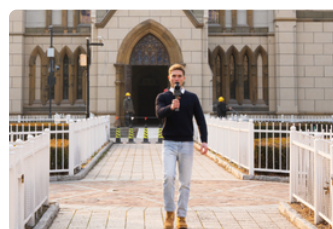
Tourisme culturel et préservation du patrimoine