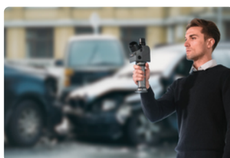
Sécurité publique et investigation légales