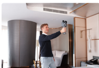
Aménagement intérieur et rénovation