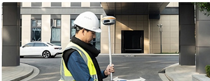
Levés de bornage

Le i93 Visual GNSS offre une connectivité complète pour des performances inégalées sur le terrain. Il intègre l'AUTO-IMU 200 Hz de CHCNAV, le Wi-Fi, le Bluetooth et le NFC pour un appairage aisé des appareils, ainsi que des modems 4G et UHF prenant en charge tous les modes de levé GNSS RTK. La gestion intelligente de l'alimentation offre jusqu'à 34 heures de fonctionnement en mode mobile réseau, éliminant le besoin de batteries supplémentaires. Son boîtier robuste en alliage de magnésium est résistant aux chocs, à la poussière et à l'eau, garantissant un fonctionnement ininterrompu dans tous les environnements.